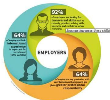
Figura 2. Efectos de la movilidad en la empleabilidad (Programa Erasmus)

Pese a estos riesgos no desdeñables, los beneficios de la internacionalización se perciben de lleno cuando nos fijamos en el paradigmático Programa ERASMUS, que ha contribuido, de la manera más potente posible, no solo a construir Europa sino a mejorar de forma constatable la formación de ciudadanos capaces y responsables y con competencias para trabajar en un entorno internacional abierto.