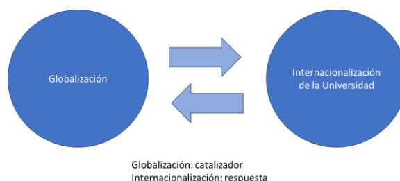
Figura 1. Globalización e Internacionalización

La internacionalización de la educación superior es la respuesta que dan las universidades y los países a estas necesidades impuestas por la globalización, que actúa como catalizador.